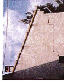
Exemple : Fissurations dues à la sécheresse